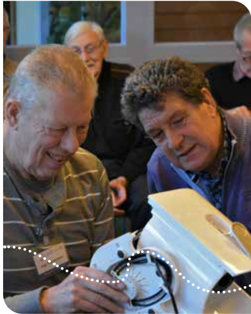
Repair Café in wijkcentrum Hooge Hasta Naaldwijk

E en lamp ophangen, een fietsband plakken of een stekker monteren. De kunst van zelf simpele karweitjes klaren, is aan het verdwijnen. Klusvaardigheden worden steeds minder van huis uit meegegeven en dat maakt mensen onzeker. ‘Westland leert klusjes’ speelt in op de onervaren klusser.