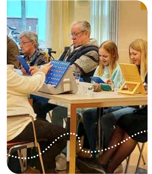
Bingo op zondag in wijkcentrum Hof van Heden Naaldwijk

High tea, optreden van een popkoor, sjoelwedstrijd, paasbingo... Het is slechts een greep uit de diverse ontmoetingsactiviteiten, die mogelijk gemaakt zijn via de regeling.