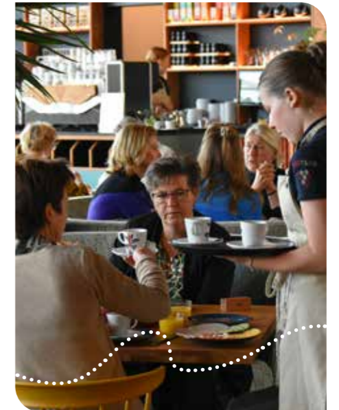
Mantelzorgontmoeting in The Vineyard Monster

Verschillende organisaties – profit en non-profit – waren tijdens de informatiemarkt aanwezig om hun diensten, producten, kennis en netwerk aan te bieden om mantelzorgers te helpen te kunnen (blijven) zorgen. Naast struinen over de markt konden bezoekers ieder uur een presentatie bijwonen. De middag was ook bij uitstek een gelegenheid om andere mantelzorgers te ontmoeten en tips en ervaringen uit te wisselen. “Contact met andere mantelzorgers verbindt. Niemand begrijpt je zo goed als degenen die in hetzelfde schuitje zitten. Dat stukje (h)erkenning kan erg fijn zijn. Daarom verzorgt Vitis door het jaar heen ontmoetingen voor mantelzorgers.”