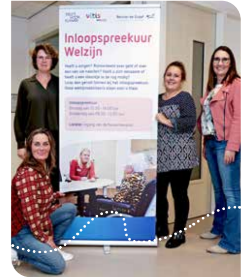
Inlooppreekuur Welzijn op Recept in het Reinier de Graaf ziekenhuis