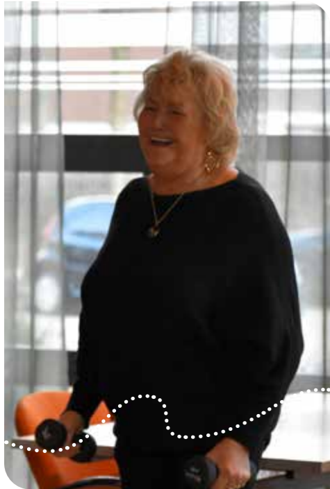
Meer Bewegen voor Ouderen in wijkcentrum Terra Nova Wateringen

E r wordt weleens gezegd dat bewegen het goedkoopste medicijn is met de gezelligste bijwerking. Voldoende lichaamsbeweging is belangrijk voor iedereen, maar nog net een beetje extra voor senioren. De wijkcentra van Vitis Welzijn spelen daarop in met beweegaanbod voor mensen met ouderdomsmotoriek: ‘Meer Bewegen voor Ouderen’.