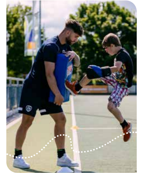
Sport en spel bij HV Westland

“Er wordt gewerkt met vrijwillige begeleiders die ervaring hebben binnen het onderwijs, jeugdwerk of het gewoon superleuk vinden om met kinderen te werken”, vertelt de projectleider. In totaal zijn er met dit project in 2023 bijna 110 kinderen bereikt. Ze zijn uitgenodigd door onder andere de sociaal makelaars van Vitis. “Zo hopen we juist de kinderen die het extra hard nodig hebben, te bereiken.”