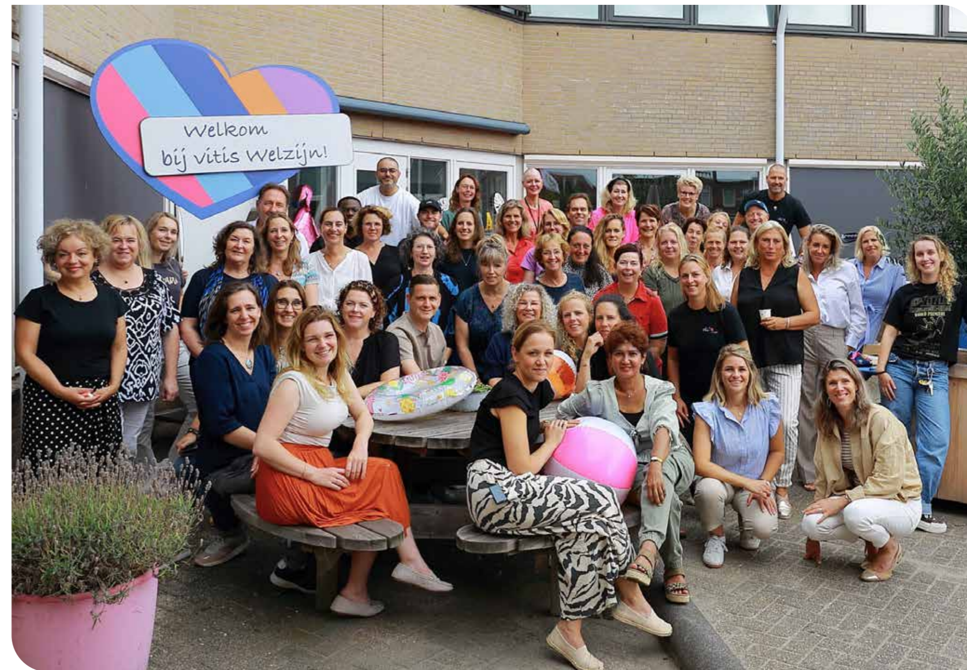
Medewerkers Vitis Welzijn, september 2024

De financiële jaarkalender is de basis voor de momenten van overleggen van de verschillende commissies en raden. Protocollen en richtlijnen worden beheerd in een documentbeheersysteem en worden tijdig geëvalueerd.